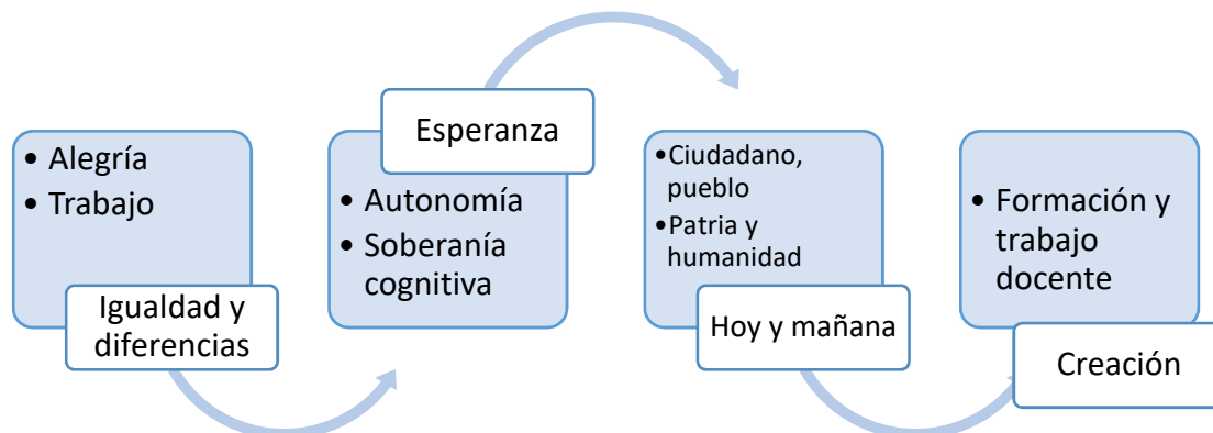
Figura 1. Simón Rodríguez y las pedagogías emancipadoras en nuestra América

Es importante mencionar a continuación, las ideas de Don Simón Rodríguez con respecto a la pedagogía nuestroamericana 4 para ello elaboré una figura que se muestra a continuación ( Figura 1 ).